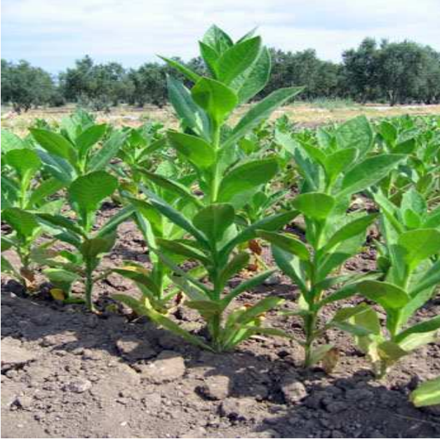
Resim 1- Tarlada tütün bitkisi

Genellikle tek yıllık bir bitki olan tütünün tarla dönemi, iklim şartlarına bağılı olarak 80-120 gündür. Farklı iklim ve toprak tiplerine adapte olmuş birçok “ menşe/çeşit ” bulunmaktadır [11].