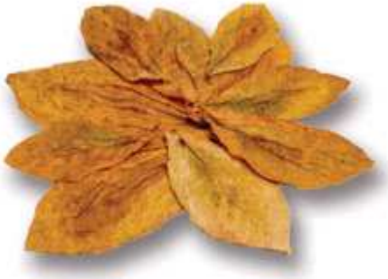
Resim 2- Kurutulmuş tütün yaprakları

Tütünü diğer bitkilerden ayıran en önemli özelliği, yapraklarında bulunan organik azotlu bir madde olan nikotindir. Kökte sentezlenen nikotin yapraklarda birikir. Nikotin, keyif verici ve alışkanlık yapıcı güçlü bir alkoloittir [11-12].