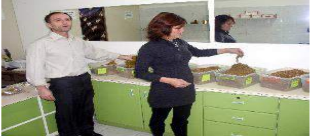
Resim 4.3. Sarmalık Kıyılmış Tütün Satılan Bir Dükkan

Farklı illerdeki Bakkal ve Bayi Odaları tarafından yapılan açıklamalarda; sigara zamlarının ardından açık tütün satışlarının arttığı, bu ürünlerin satıldığı ruhsatsız dükkanların açıldığı, özellikle bakkalardaki satışların %60 azaldığı, yasaya göre valiliklerin duruma müdahale etmesi gerektiğini ifade edilerek, Valiliklerden duruma müdahale etmeleri istenmiştir.