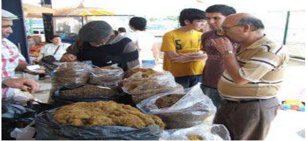
Resim 4.2. Pazar Yerinde Sarmalık Kıyılmış Tütün Satışı

2006 yılında yayınlanan raporun Doğu ve Güneydoğu Anadolu Bölgelerinde Üretilerek Yasadışı Yollarla Kıyılıp Satışı Yapılan Sarmalık Kıyılmış Tütün” başlıklı bölümünde, “...Doğu ve Güneydoğu Anadolu Bölgelerinde üretilen ve yasadışı yollarla satışı yapılan sarmalık kıyılmış tütün, ağırlıklı olarak aynı bölgelerde gelir seviyesi düşük vatandaşlar tarafından geleneksel olarak tüketilmekte iken son dönemlerde büyük kent merkezlerinde pazar yerlerinde yasadışı olarak satılır hale gelmiştir. Kıyılmış tütüne olan talep artmaya başlayınca bu tütünlerin içilmesini kolaylaştırıcı tütün sarma ve doldurma gereçleri de talep görmeye başlamıştır.” denilerek soruna yer verilmiştir.